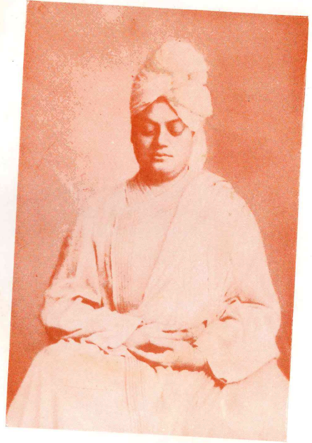
श्री स्वामी विवेकानन्द जी महाराज